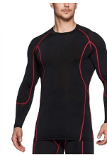
ラインに同系色では 無い色がついてる