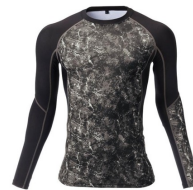
模様がある。単色ではない。