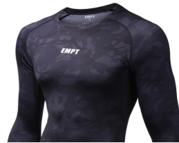
模様があるが 単色と認定できます。