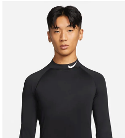
ロゴが入っている