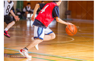
コンプレッションの ウェアではない