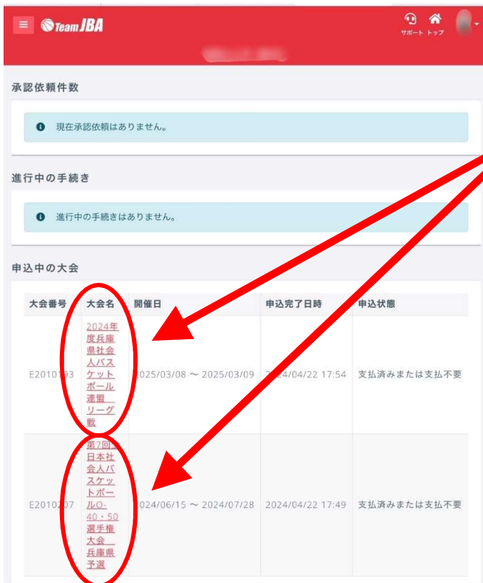
(参考) チーム代表者様TOP画面 (ipad mini画面)