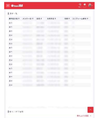
(参考) 選手 (ipad mini画面)