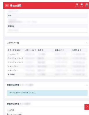
(参考) スタッフ (ipad mini画面)