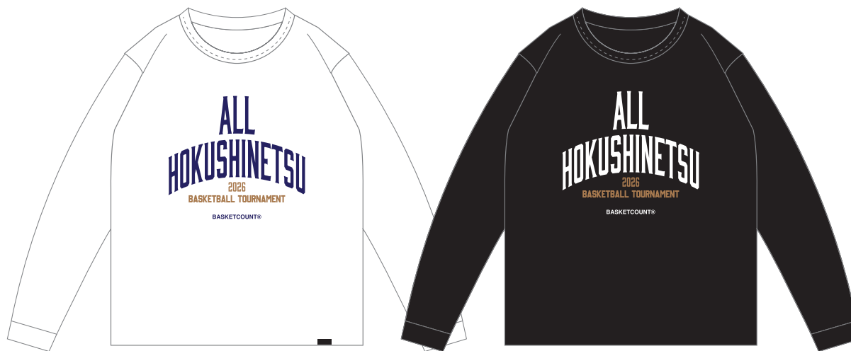
ロングTシャツ / ホワイト、ブラック / 4,000円(税込)