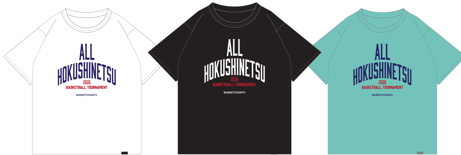
Tシャツ / ホワイト、ブラック、ミント / 3,500円(税込)